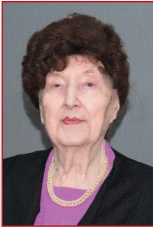
Посвящается памяти профессора Нины Николаевны Кузьминой (1929–2019)